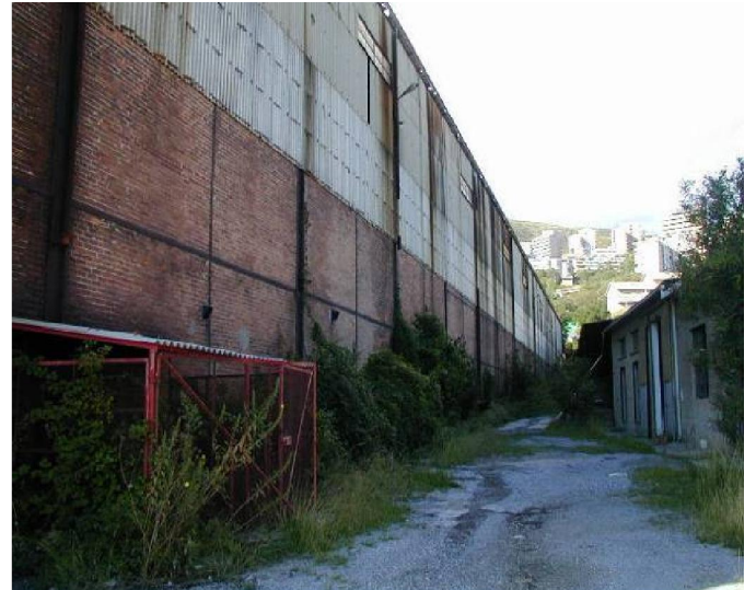
FOTO 8. I CAPANNONI INDUSTRIALI VERSO LEVANTE