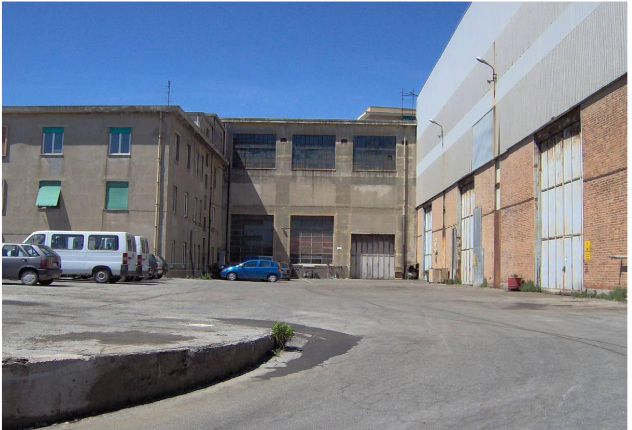
FOTO 10. PIAZZALE DI ACCESSO ALLA QUOTA SOPRAELEVATA RISPETTO ALLA VIA AURELIA