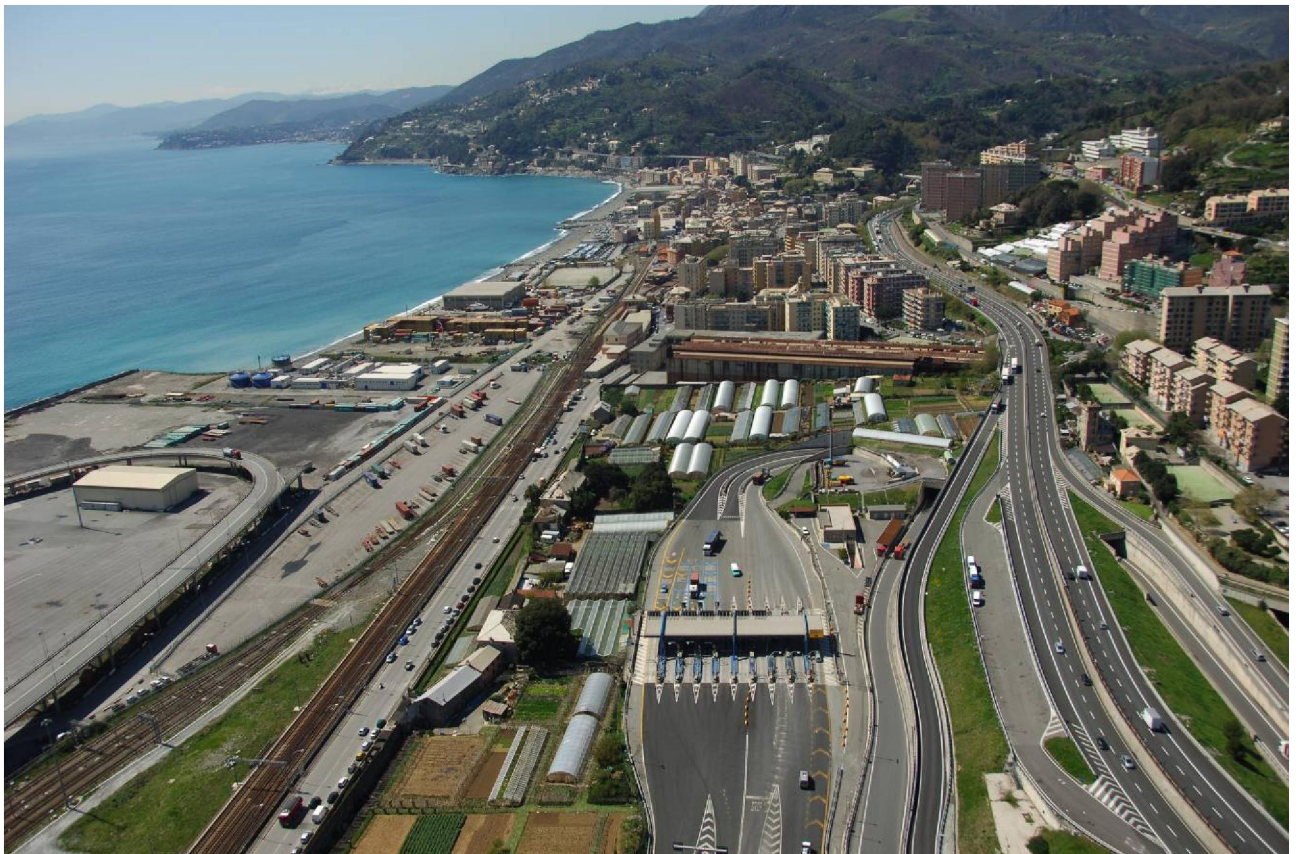
FOTO 2. VEDUTA AEREA DA LEVANTE