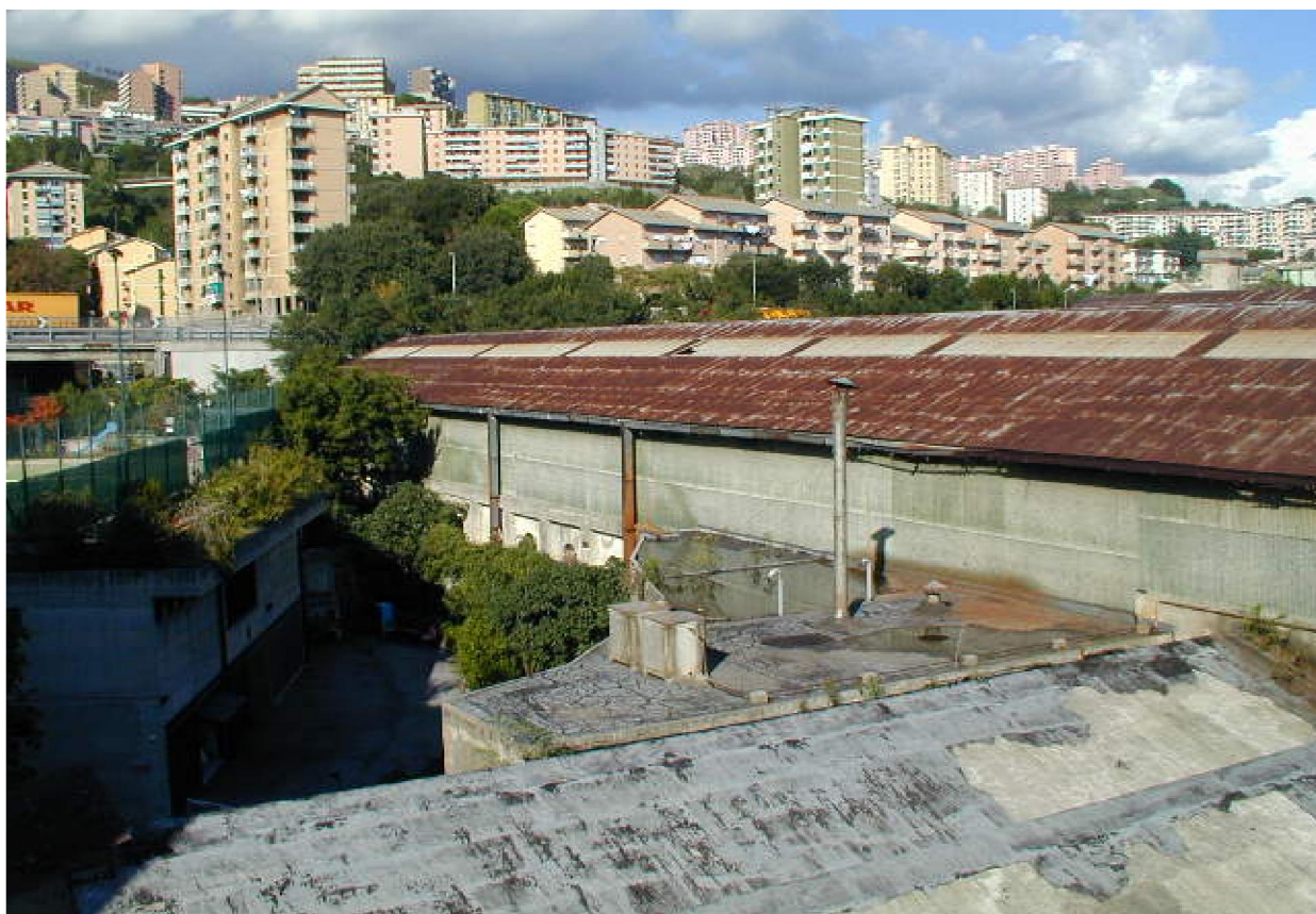
FOTO 17. L'ESPANSIONE RESIDENZIALE SULLE ALTURE DI PRA'