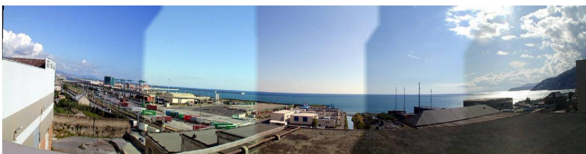
FOTO 21. PANORAMICA DELLA COSTA