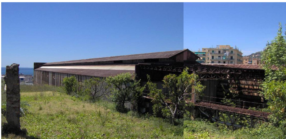
FOTO 19. CAPANNONI VISTI DALL'AREA DELLE SERRE DI PRA'