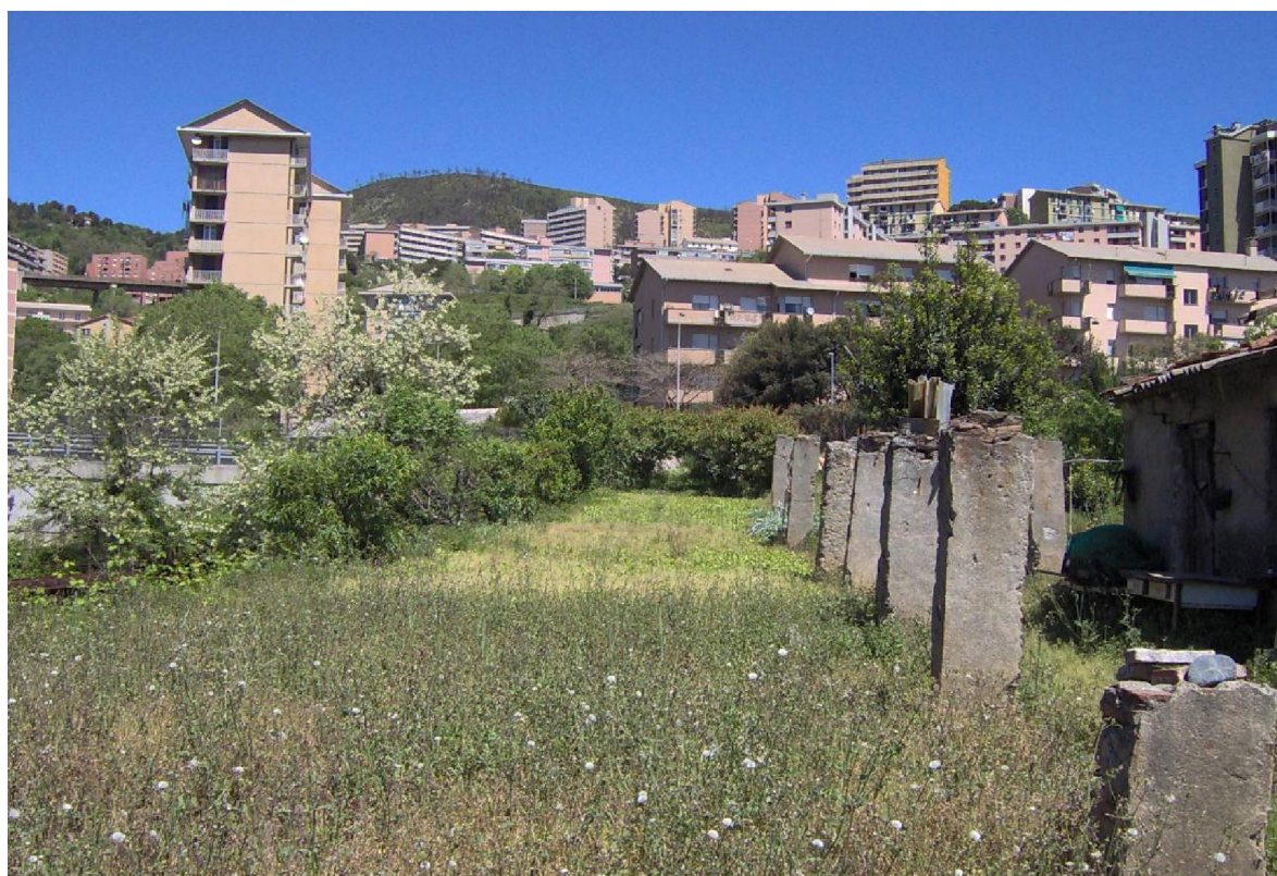
FOTO 20. PARTE DELL'AREA VERDE VERSO LE SERRE