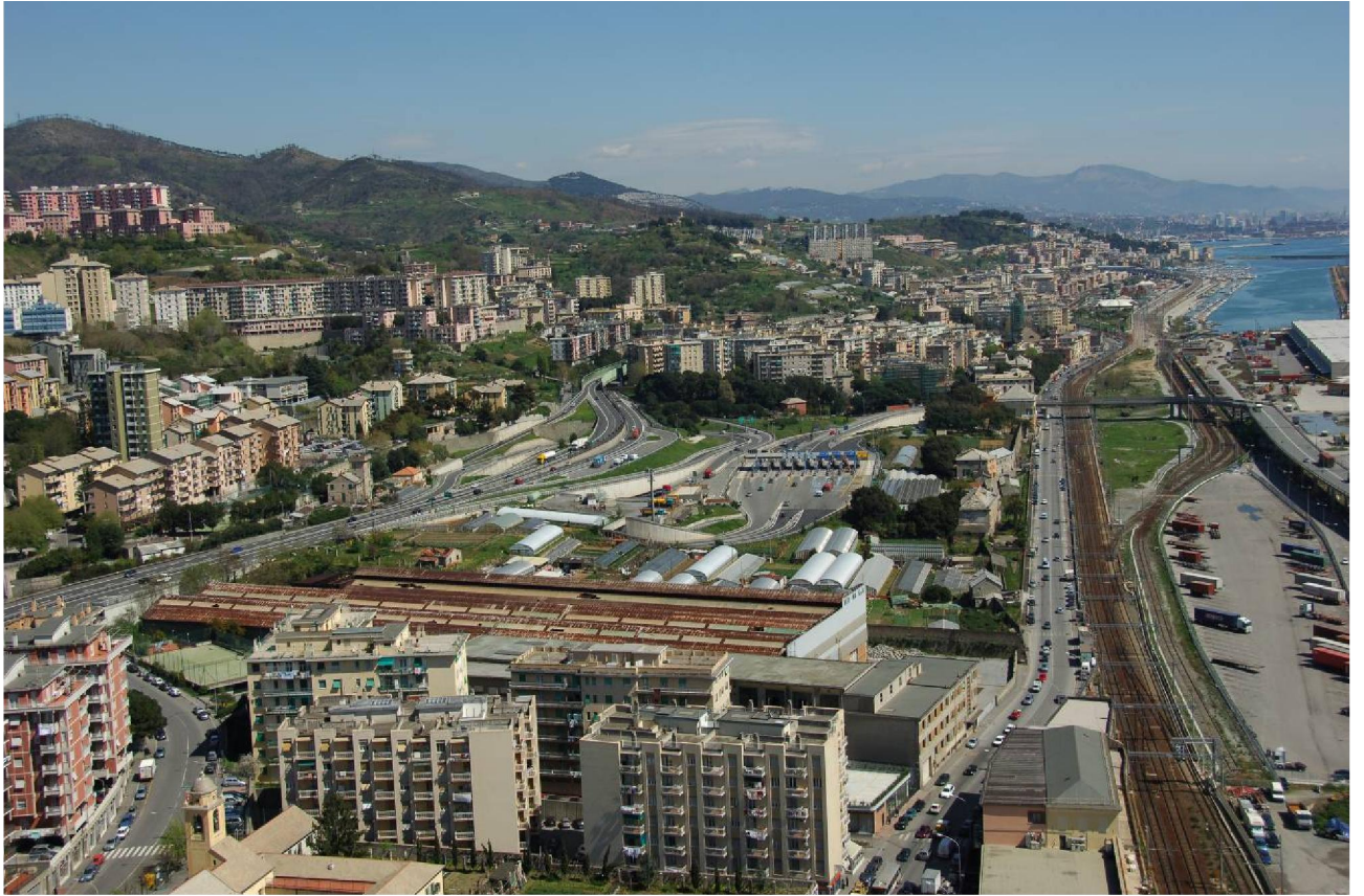
FOTO 1. VEDUTA AEREA DA PONENTE