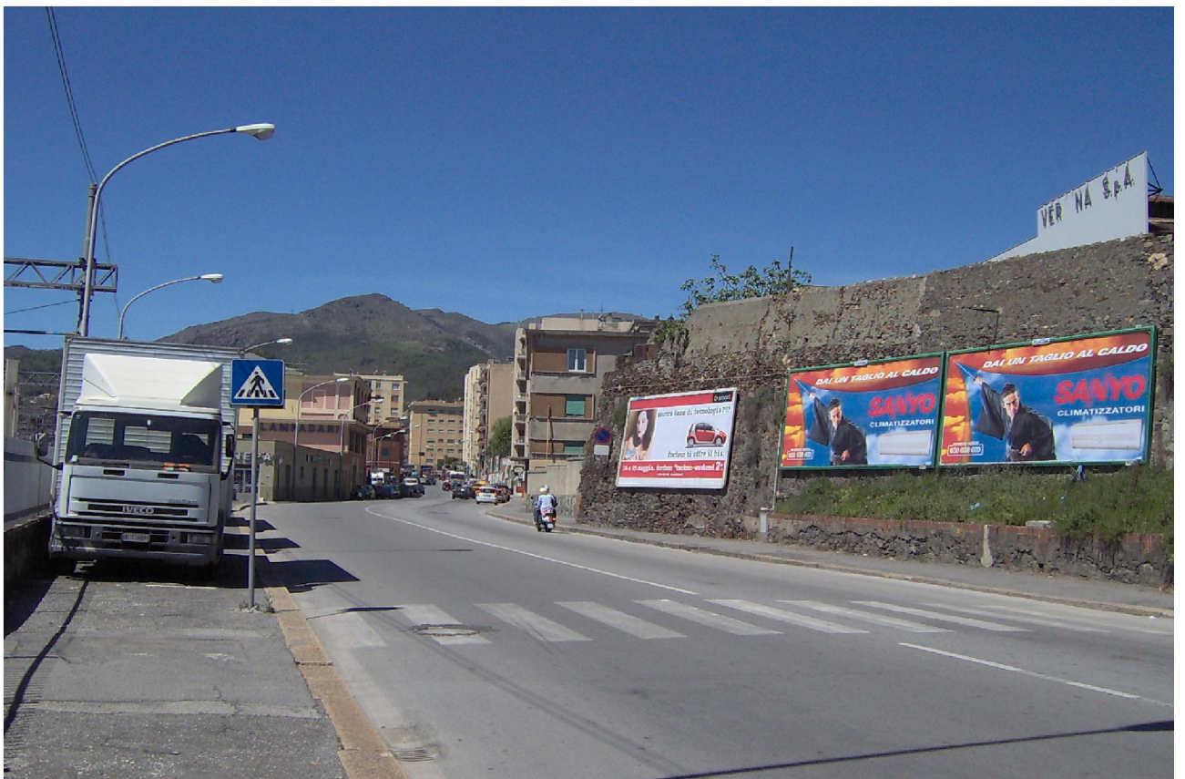
FOTO 4. VIA AURELIA