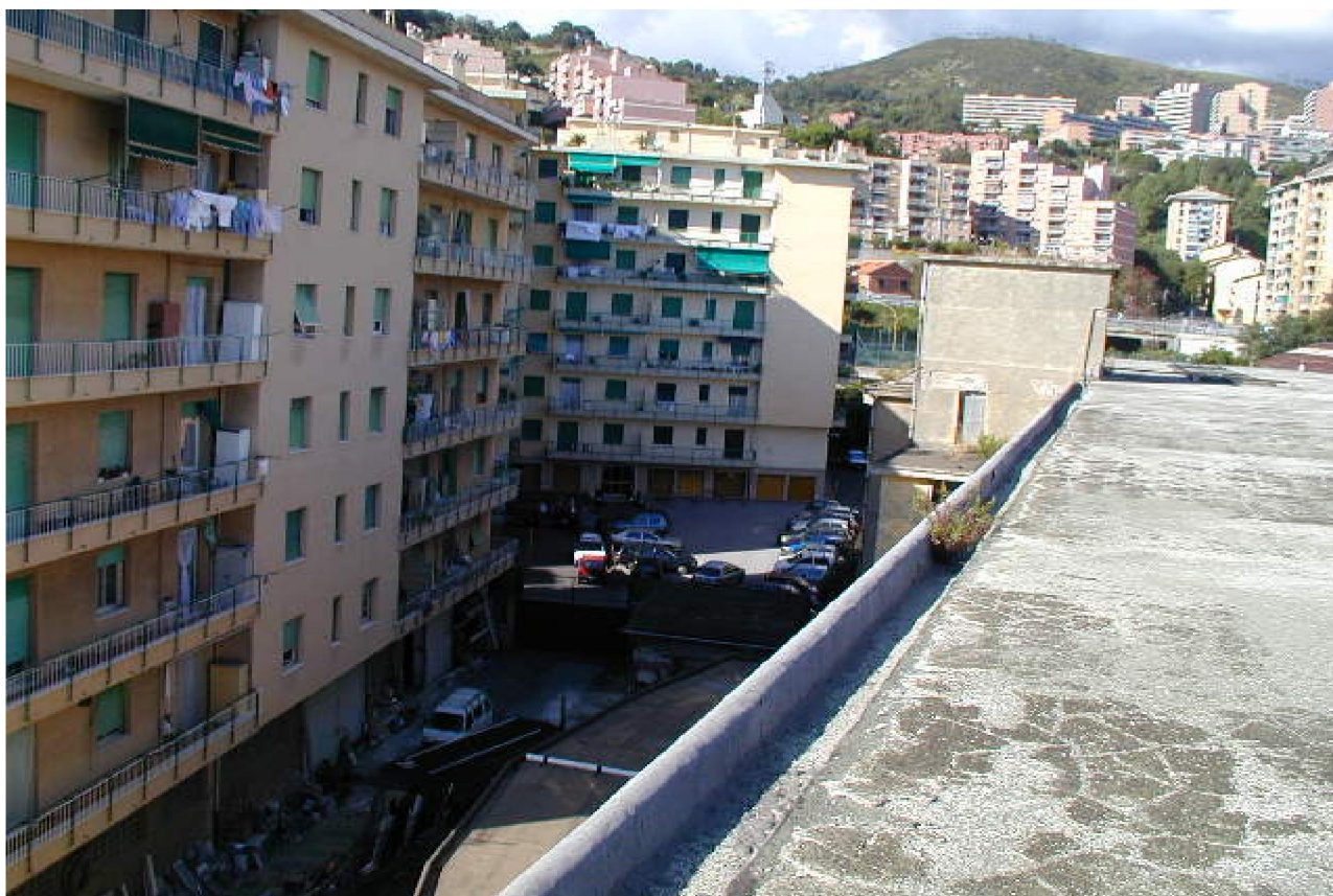
FOTO 6. IL PERIMETRO VERSO L'ABITATO A PONENTE