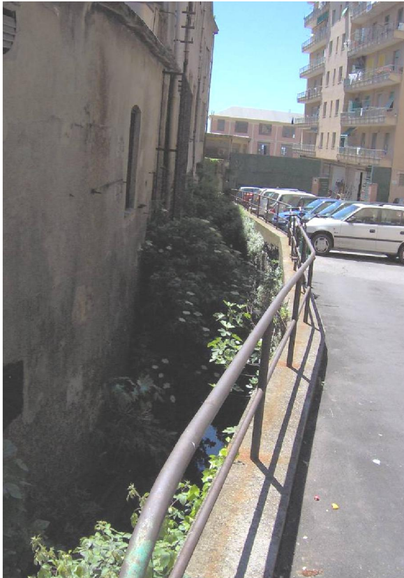
FOTO 7. PERIMETRO A PONENTE E IL RIO SAN GIULIANO VERSO LA VIA AURELIA