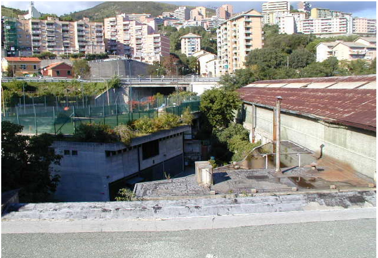
FOTO 9. PERIMETRO A PONENTE E IL CONFINE CON IL RIO SAN GIULIANO VERSO L'AUTOSTRADA