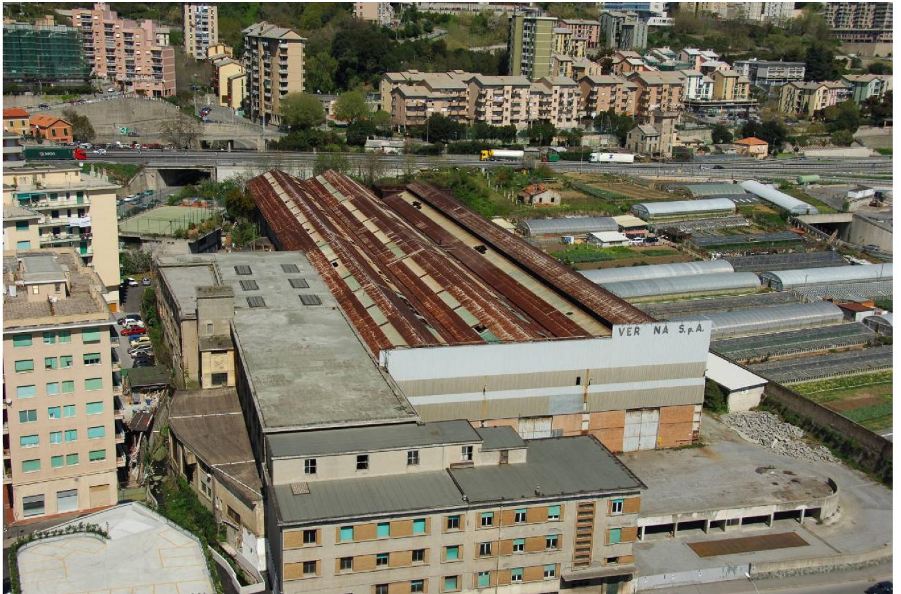
FOTO 3. VEDUTA AEREA DEL COMPLESSO INDUSTRIALE